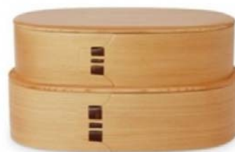
「曲げわっぱ 弁当箱」