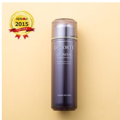
スキンケア編 化粧水部門 大賞 コスメデコルテ リポソーム トリートメント リキッド