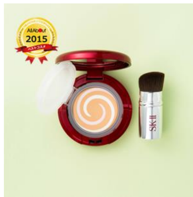
メイク編 リキッドファンデーション部門 大賞 SK-II COLOR クリア ビューティ アルティザン ブラシ ファンデーション (モイスト)