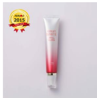
特別編 最多ノミネート賞 アスタリフト ホワイト パーフェクト UV クリアソリューション