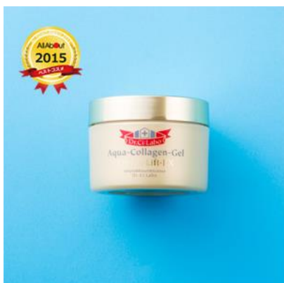
通販コスメ編 オールインワン化粧品部門 大賞 ドクターシーラボ アクアコラーゲンゲル エンリッチリフト EX