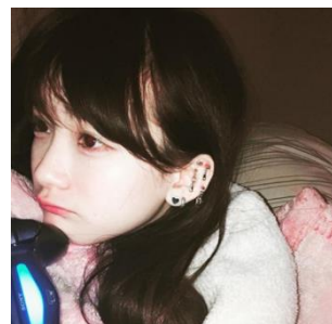
【金子理江】 ミスiD2015グランプリ。4人組アイドルグループ「LADYBABY」所属。 Twitterフォロワー数：11万人 Instagramフォロワー数：7.7万人