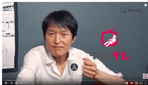
千原ジュニア 『チルトーク』