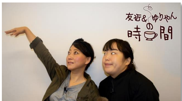
友近 ゆりやんレトリィバア