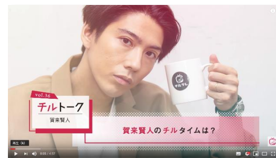
賀来賢人 『チルトーク』