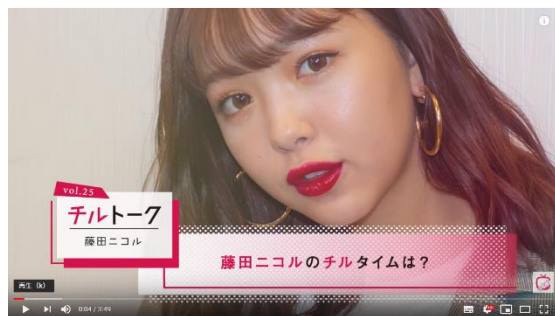
藤田ニコル 『チルトーク』