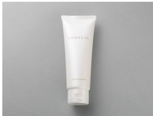
クレンジング・洗顔部門 1 位 ルナソル スムージングジェルウォッシュ