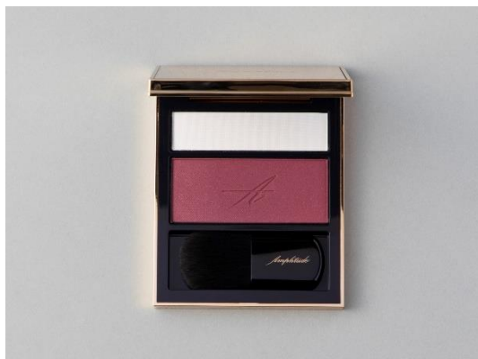
チーク部門 1 位 Amplitude コンスピキュアス チークス 08 ディープローズ