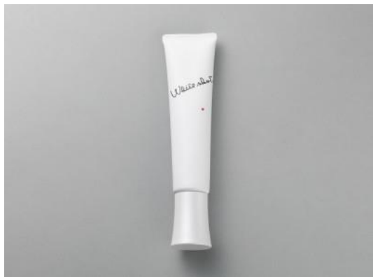
ベストコスメ 2019 総合 1 位 ホホワイトショット MX