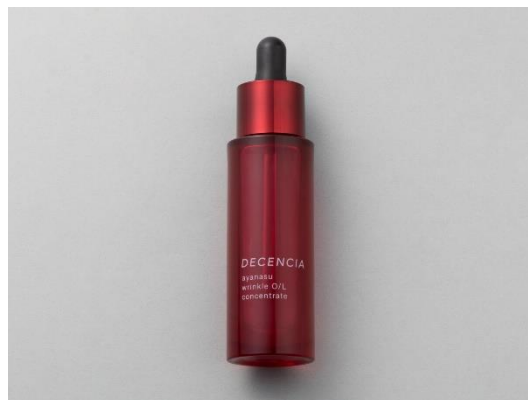
(通コス) エイジングケア部門 1 位 アヤナス リンクル O/L コンセントレート (医薬部外品)