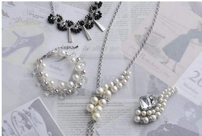
かぎ針で編むワイヤーアクセサリーディプロマ通信講座作品例