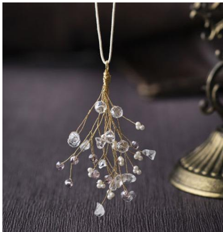
小枝アクセサリー通信講座 Lesson1「天然石さざれの小枝ペンダント」

https://ec.athuman.com/products/detail/1742