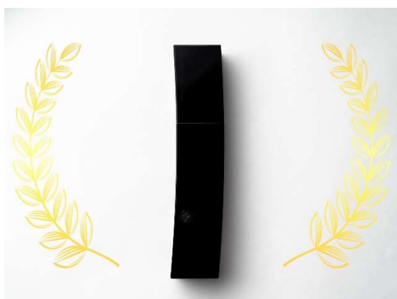
総合1位 ポーラ「B.A ローション」