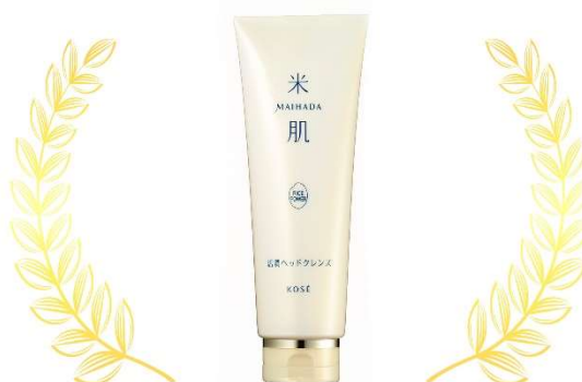
(通販コスメ編) ボディ&ヘアケア部門 1位 米肌「活潤ヘッドクレンジ」