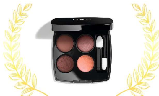
アイシャドウ部門 1位 シャネル「レ キャトル オンブル 354」