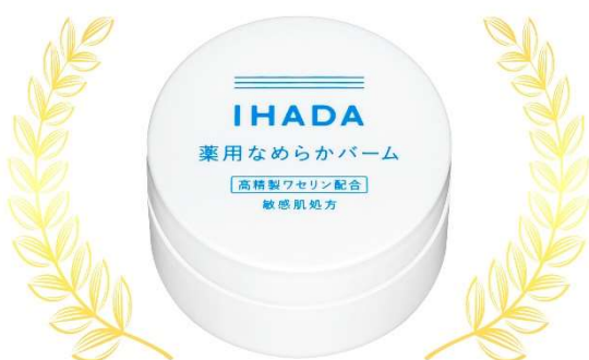
プチプラススキンケア部門 1位 イハダ「薬用クリアバーム」【医薬部外品】