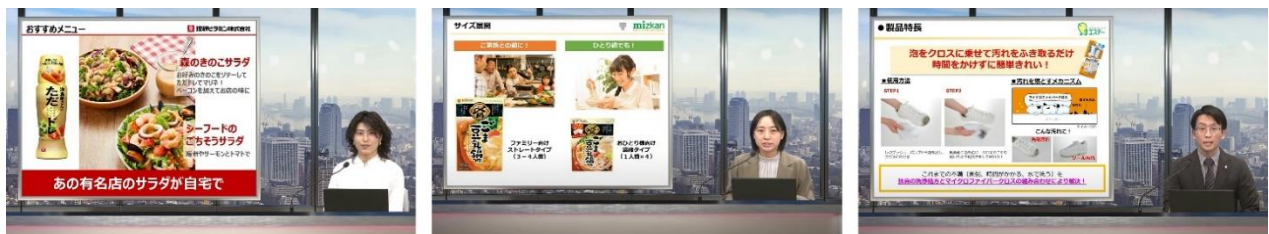
RSP 106th Liveの様子

「リアルサンプリングプロモーションライブ（RSP Live）」は、YouTube上で開催する大規模オンラインサンプリングイベントです。参加者のご自宅へサンプリング商品をお送りしながら、オンライン上のイベントを視聴いただく企画として開催しています。全国各地から居住地を限定されず、外出せずに自宅から参加いただけるため、会員の皆様に人気のイベントです。