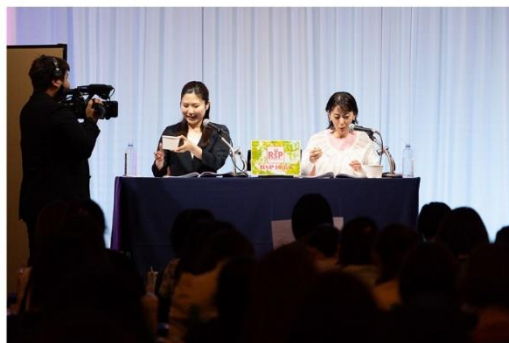
前回のリアル開催「リアルサンプリングプロモーション 103rd（RSP103rd）」の様子