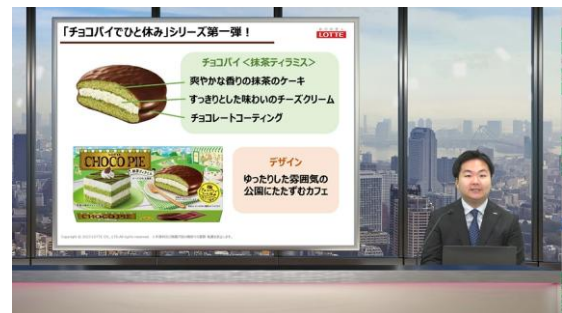
RSP 108th Liveの様子