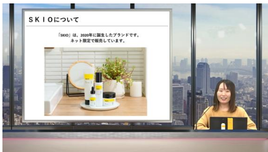
RSP 107th Liveの様子

「リアルサンプリングプロモーションライブ（RSP Live）」は、YouTube上で開催する大規模オンラインサンプリングイベントです。参加者のご自宅へサンプリング商品をお送りしながら、オンライン上のイベントを視聴いただく企画として開催しています。全国各地（日本国内限定・北海道、沖縄、離島除く）から、外出せずに自宅で参加いただけるため、会員の皆様に人気のイベントです。