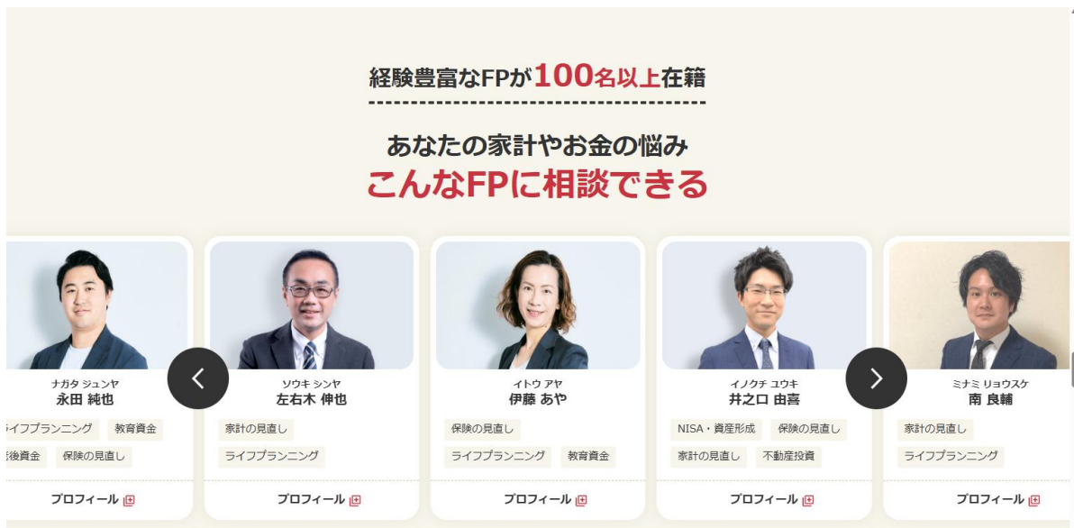
「All About家計相談所」サービスサイト