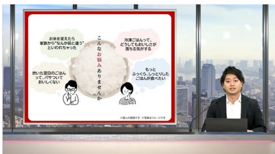
RSP 第113回 Liveの様子

「リアルサンプリングプロモーション ライブ（RSP Live）」は、YouTube上で開催する大規模オンラインサンプリングイベントです。参加者のご自宅へサンプリング商品をお送りし、オンライン上のイベントを視聴いただく企画として開催しています。全国各地（日本国内限定、沖縄、離島除く）から、外出せずに自宅で参加いただけるため、会員の皆様に人気のイベントです。